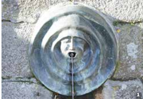
1. SAINT-GEORGES-BUTTAVENT, FONTAINE-DANIEL, DÉTAIL DE LA FONTAINE